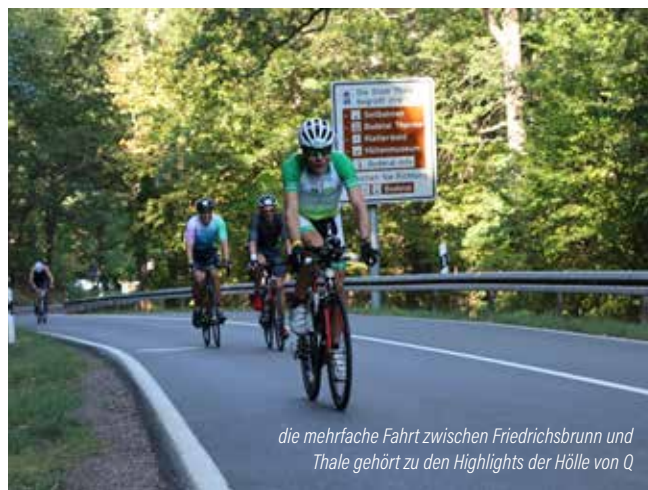
die mehrfache Fahrt zwischen Friedrichsbrunn und Thale gehört zu den Highlights der Hölle von Q

Wenn am 3. September erneut hunderte Triathleten auf ihre Reise von Dittfurt durch den Harz nach Quedlinburg gehen, erwartet sie vermutlich eine neue Radstrecke. Denn wegen einer Baustelle bei Treseburg wird es in diesem Jahr nach dem Stand von Anfang Juni wohl nicht möglich sein, von Westen her nach Friedrichsbrunn zu fahren. Stattdessen wird aktuell eine Alternative über Stecklenberg und Bad Suderode geplant. Von Friedrichsbrunn ginge es dann wie gehabt nach Thale – um dort zu wenden, erneut nach Friedrichsbrunn und dann endgültig nach Thale zu fahren. Sobald die Streckenplanung abgeschlossen ist, wird an dieser Stelle und unter www.hoelle-von-q.de darüber informiert. Natürlich würden in diesem Falle auch Helfer entlang der neuen Strecke gesucht. Interessierte können sich gern über info@hoelle-von-q.de melden.