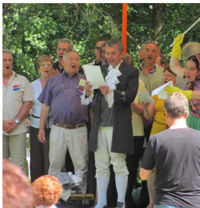
Franzosen singen ihre Marseillaise beim Brühlfest unter dem Motto Vive la France