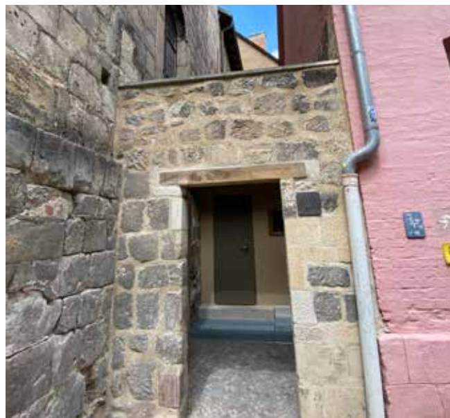
Zugang zur neuen Toilettenanlage in der Blasiistraße

An der Kulturkirche St. Blasii wurde die Sanitäreanlage neu gebaut und kann bereits seit Anfang Juni öffentlich genutzt werden. Der Zugang ist mit festen Öffnungszeiten über eine Zeitschaltung geregelt (10 bis 18 Uhr und kostenfrei). Die behindertengerechte Toilette ist über den Innenhof der Kirche zu erreichen. Die Reinigung der Toilettenanlagen erfolgt täglich durch einen externen Dienstleister. Der Bereich Kulturförderung der Stadt kann diese WC's nun für ihre vielen Veranstaltungen nutzen. Sie ersetzt zukünftig auch die Toilette am Marktkirchhof, die dringend sanierungsbedürftig ist und ab Ende Juni geschlossen wird. Weitere öffentliche Toiletten sind im Wordgarten, auf dem Parkplatz Marschlinger Hof, dem Parkplatz An den Fischteichen und im Bahnhofsgebäude. In Bad Suderode und Gernode gibt es ebenfalls öffentliche Toiletten. Weiterhin ist es auch möglich, die Toiletten der Hotels und in der Gastronomie gegen eine Gebühr zu nutzen.