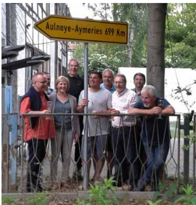
Freundschaft trotz größerer Entfernung

Vive la France, Vive l'Allemagne, Vive l'Aulnoye-Aymeries, Vive la Quedlinburg!