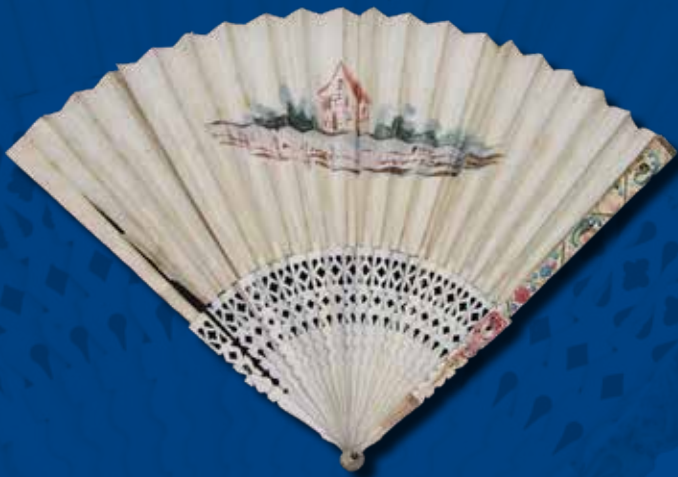
Faltfächer, Papier, Horn, B 51 cm, H 28,3 cm.

Die Städtischen Museen und das Archiv der Welterbestadt Quedlinburg präsentieren