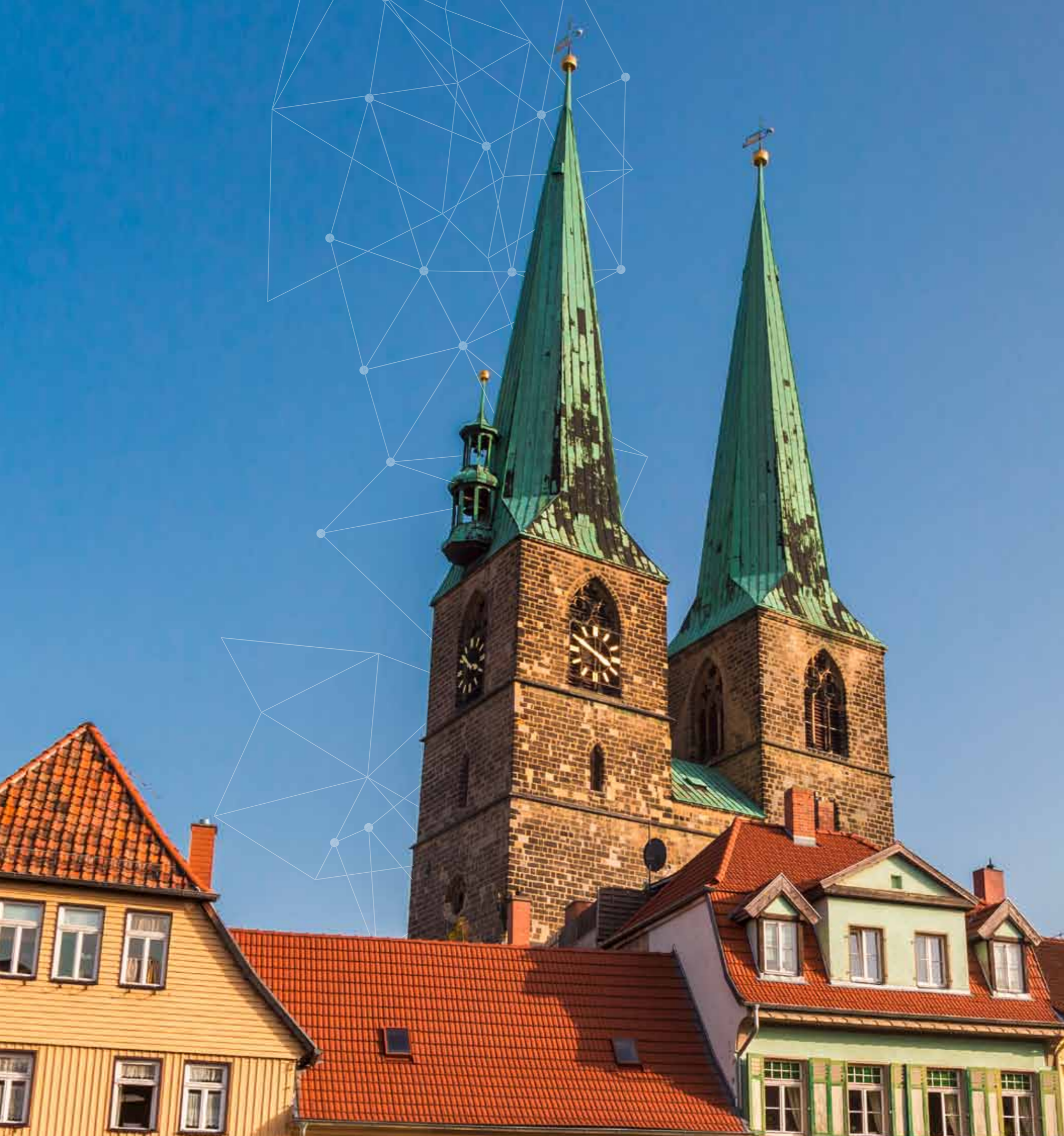
2 Kirche St. Nikolai; Titelbild: Blick über den Stiftsberg und die historische Altstadt