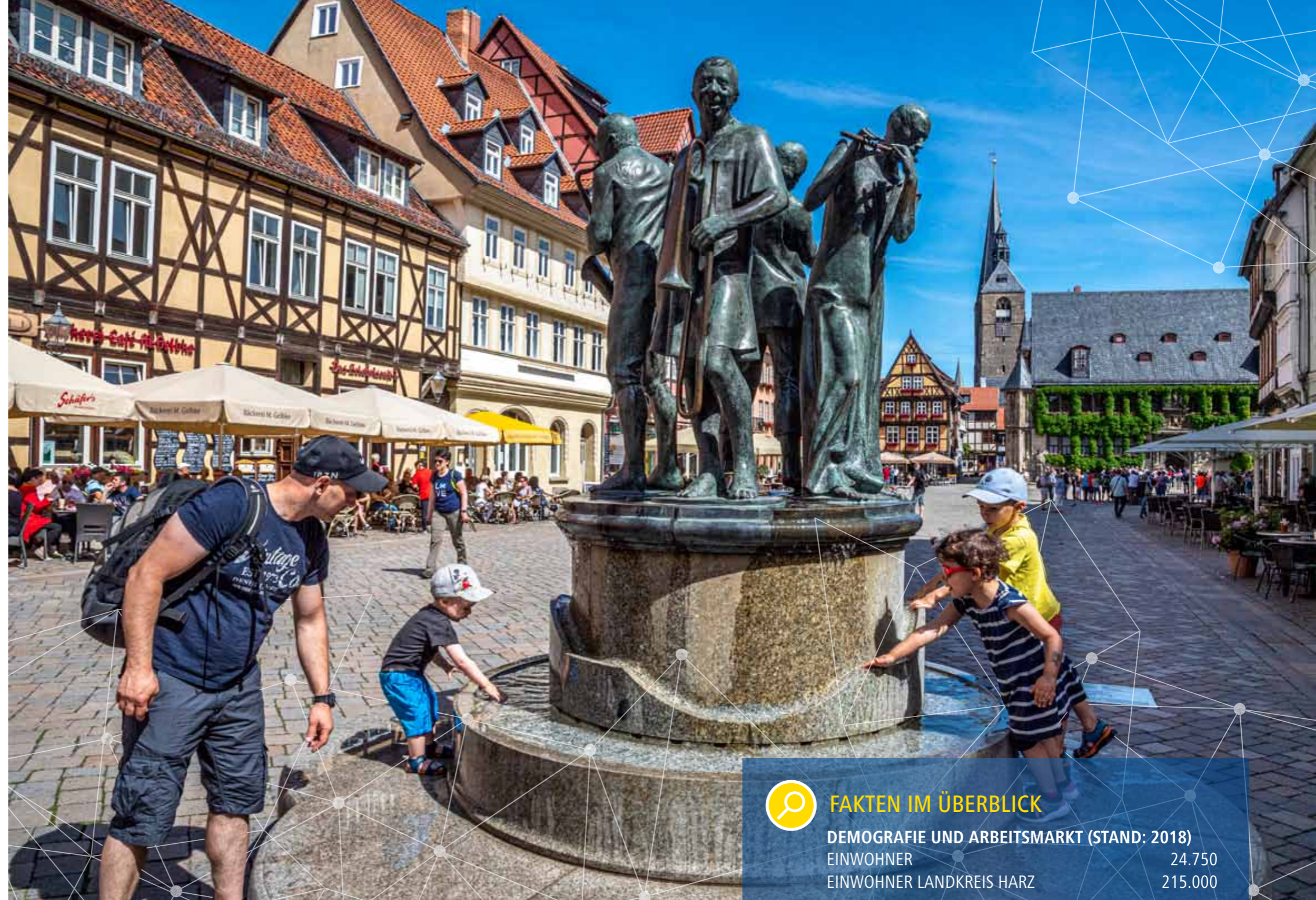
Denkmal Münzenberger Musikanten auf dem Marktplatz

Frank Ruch, Oberbürgermeister der Welterbestadt Quedlinburg