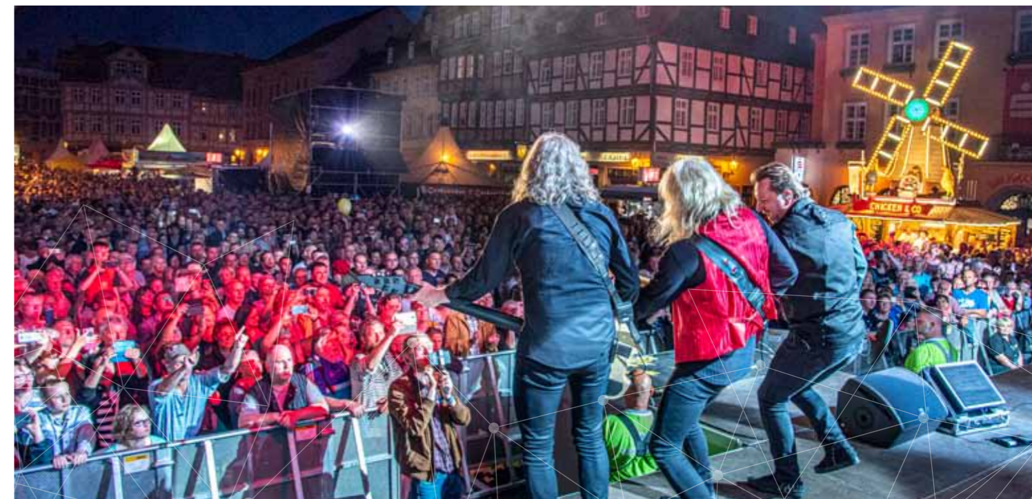
Open-Air Veranstaltungen auf dem Münzenberg (oben) und auf dem Markt (unten)

IN QUEDLINBURG FINDEN SIE DIE GRÖSSTE KAFFEEHAUSDICHTE NÖRDLICH DER ALPEN. EIN BEWEIS FÜR DIE BESONDERE LEBENSQUALITÄT, DIE UNSERE STADT ZU BIETEN HAT.