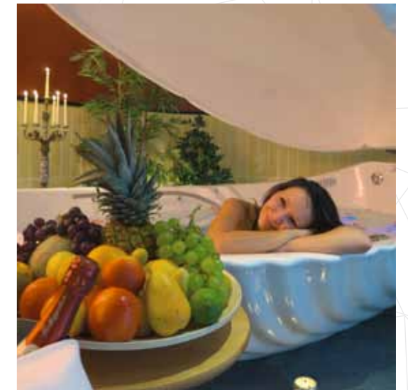
Floating Muschel: Schwereloses treiben in warmer Sole im Hotel Baleolum