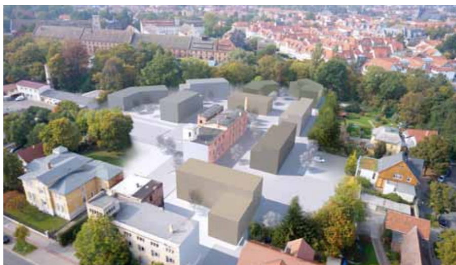
Modernes Wohnen in „Brauns Quartier“