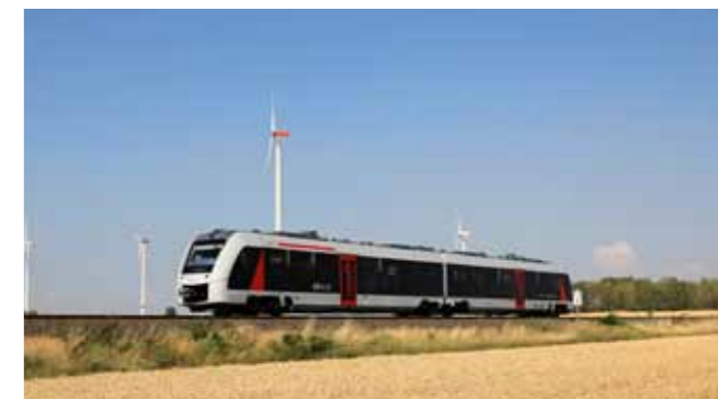
Abellio bietet gute Verkehrsanbindungen im Regionalverkehr.

Die Welterbestadt Quedlinburg liegt in der Mitte Deutschlands und im Herzen Europas. Günstig gelegen in einer der wirtschaftlich stärksten Regionen Sachsen-Anhalts (#moderndenken) und verkehrstechnisch sowie digital hervorragend angebunden, bieten wir für Investitionen auch infrastrukturell beste Bedingungen.