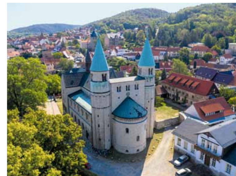
Links: Ballettaufführung des Nordharzer Städtebundtheaters Rechts: Stiftskirche St. Cyriakus in Gernode

Herausragende Bedeutung für die Lebensqualität der Welterbestadt Quedlinburg hat ohne Zweifel die Lage im direkten Harzvorland. Nach Feierabend oder am Wochenende geht es für viele raus in die Natur, mit der Harzer Wandernadel auf Stempeljagd oder auf die Suche nach der besten Abfahrt beim Mountainbiking.