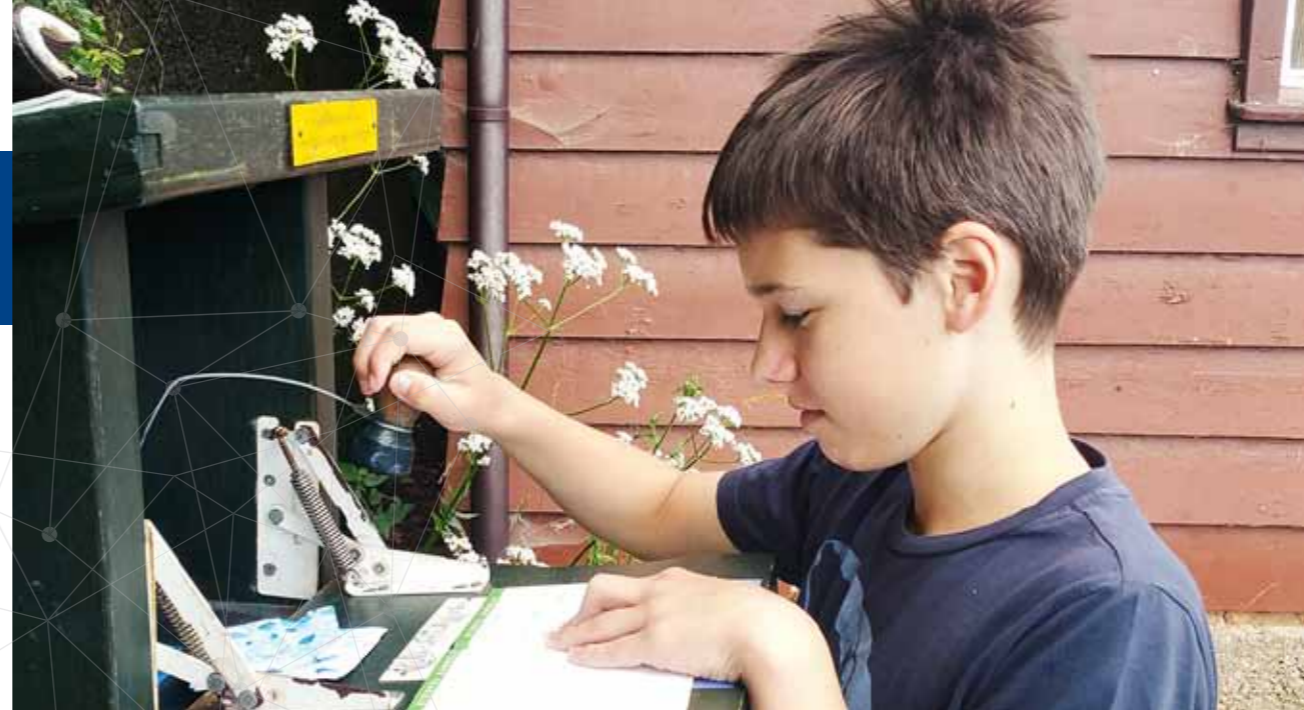
Mit der Harzer Wandernadel auf Stempeljagd

Sämtliche Ortschaften der Welterbestadt sind gemäß der Kurortverordnung des Landes Sachsen-Anhalt klassifiziert und bieten ein natürliches Erholungs- und Arbeitsklima. Wellnessangebote und der Harz als Gesundheitsregion sind von besonderer Bedeutung für die Tourismuswirtschaft. Die Gesundheitswirtschaft selbst vernetzt sich auf dem „Quedlinburger Gesundheitstag“.