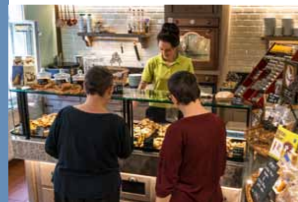
Oben: Weinstube im Romantik Hotel am Brühl Unten: Manufaktur „Keks-Art“