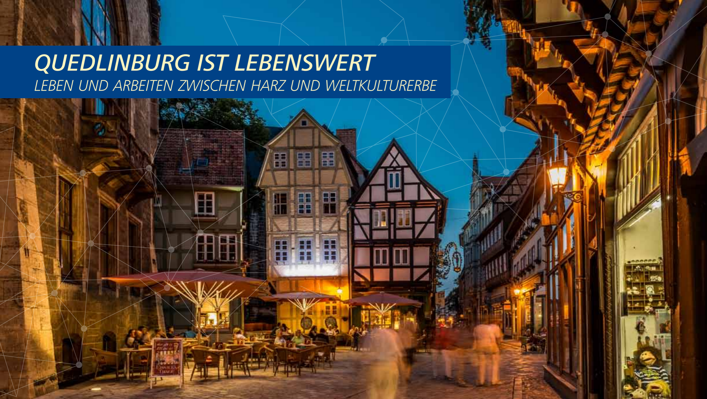
Zahlreiche Cafés mit einzigartigem Charme