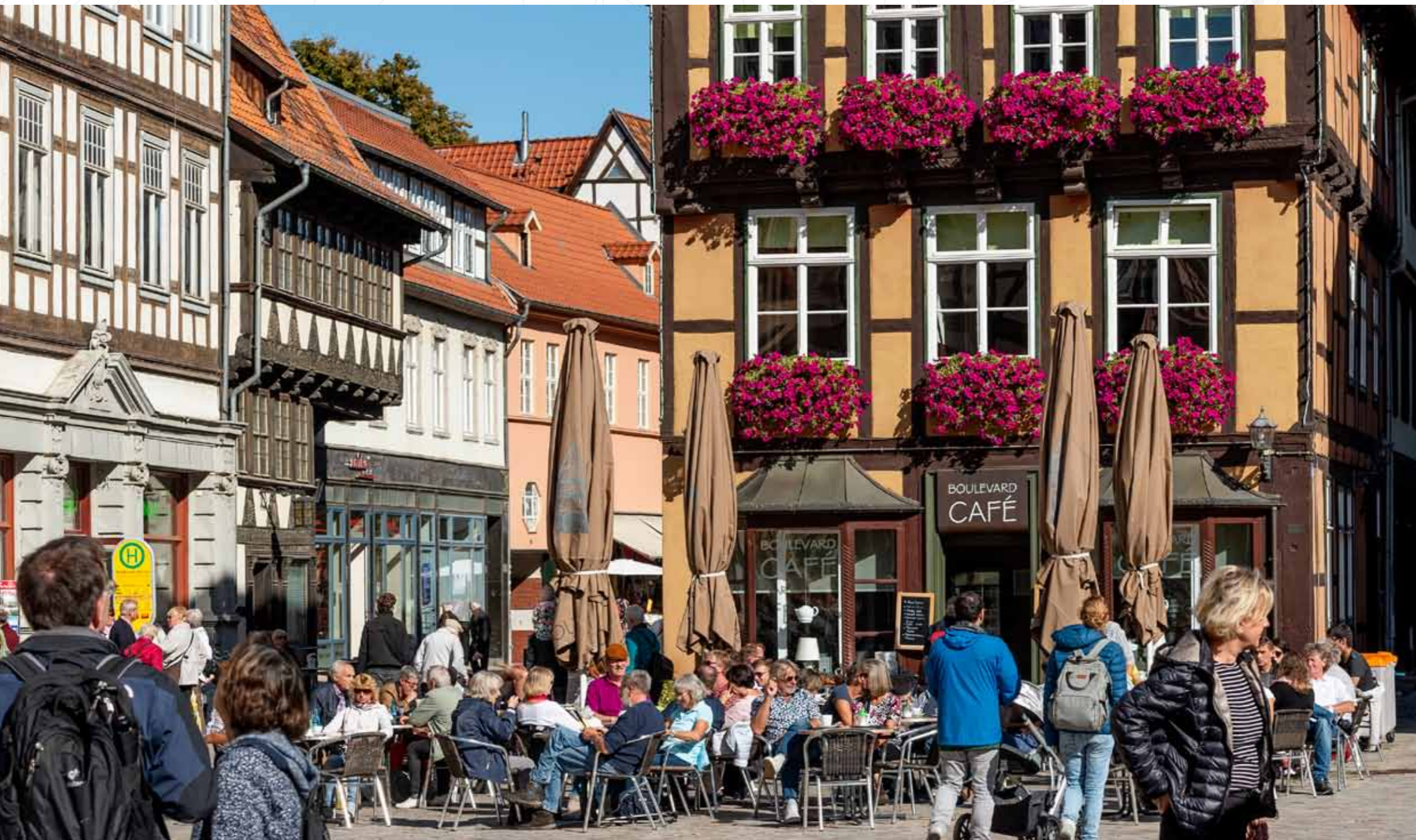
Café am Marktplatz