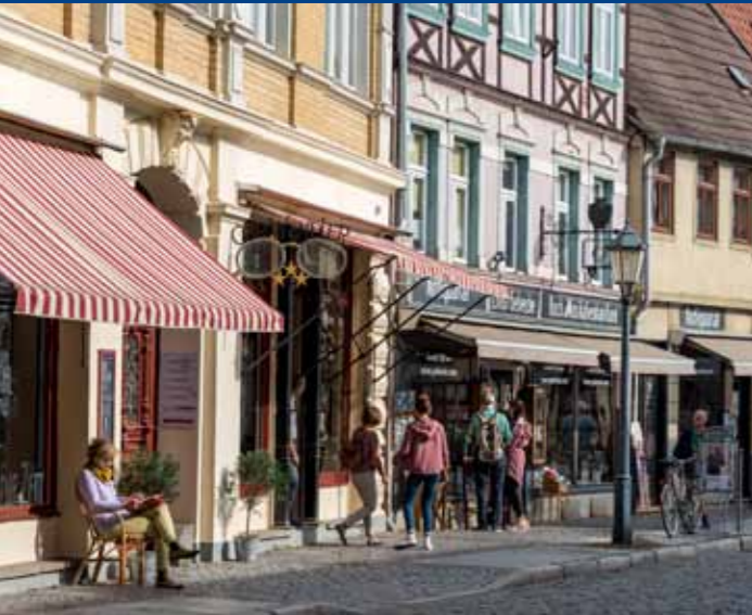
Inhabergeführte Geschäfte in der Pölsenstraße