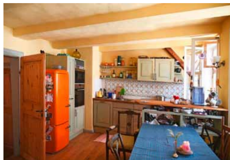
Wohnen im Fachwerk

Die Welterbestadt Quedlinburg ist zu einem Sehnsuchtsort geworden. Schon seit längerem ist der Wanderungssaldo positiv. Öffentliche und private Unternehmen investieren wieder großflächig in die Entwicklung von attraktivem Wohnraum für alle Zielgruppen. Ob Wohnen im Fachwerk oder im Industriedenkmal, in der Innenstadt oder im klassischen Einfamilienhaus in attraktiver Stadtrandlage – Quedlinburg wächst und bietet immer mehr Menschen die Verwirklichung ihres Wohn(t)-raumes.