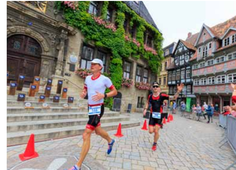
Zieleinlauf des Triathlons „Hölle von Q“